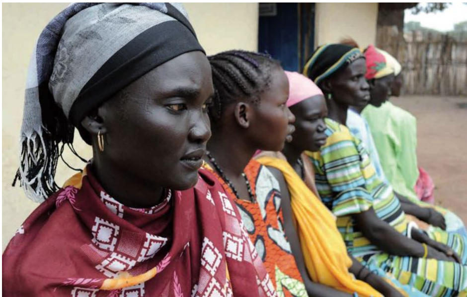
Brot für die Welt widmet seinen Schwerpunkt zum Weltfrauentag Frauen in südlichen Ländern.

Behinderung abnimmt. Jeder Mensch muss Zugang zu den Angeboten der reproduktiven Gesundheit haben, die sie oder er will und braucht“, so Lassmann.