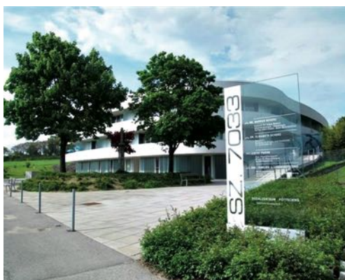
Die Familienberatungsstelle in Pötttsching

Vor über acht Jahren hat die Evangelische Ehe-, Familien- und Lebensberatungsstelle in Pötttsching ihre Tore geöffnet. Die