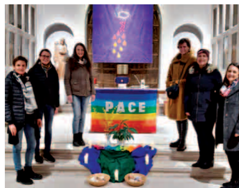
Weltgebetstag - r.k. Kirche Stoob

Der Weltgebetstag in Österreich unterstützt in sechs