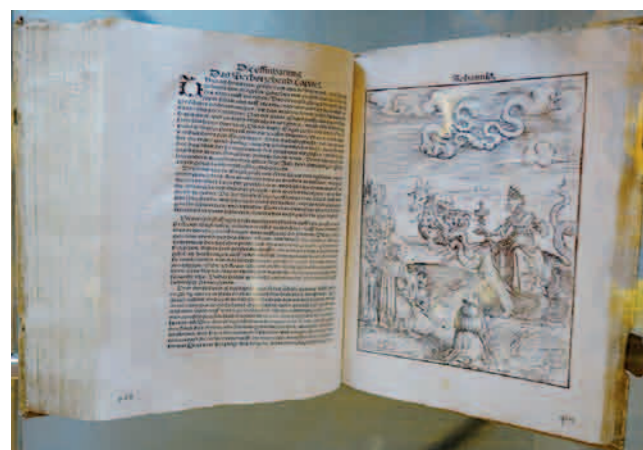
„Septembertestament“ (Museum im Melanchthonhaus Bretten)

Auf Anraten Melanchthons und mit dem kurz zuvor vom Humanisten Erasmus von Rotterdam herausgegebenen griechischen Originaltext ausgestattet, raffte sich Luther auf, statt Trübsal zu blasen, das Neue Testament ins Deutsche zu übersetzen. Die 27 Bücher des Neuen Testaments umfassen die vier Evangelien, die Apostelgeschichte, das prophetische Buch (Offenbarung des Johannes) und 21 Briefe, von denen jene des Apostels Paulus die ältesten sind. Die Übersetzung gelang Luther