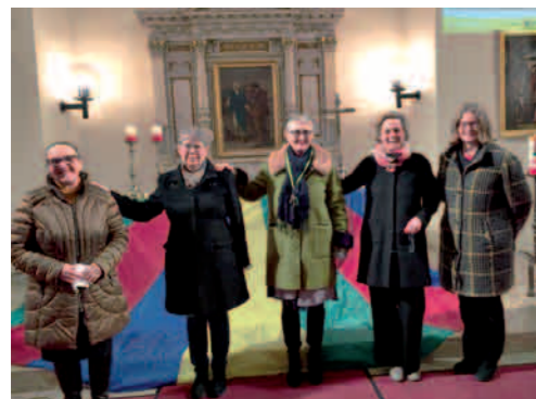
Weltgebetstag - evangelische Kirche Gols

Diesmal stammte die Liturgie aus England, Wales und Nordirland. Die Frauen aus England, Wales und Nordirland thematisieren die Kolonialgeschichte des Vereinigten Königreiches und möchten mit dem Weltgebetstag Hoffnung in hoffnungslosen Zeiten, Pläne des Friedens und der Zuversicht schenken.