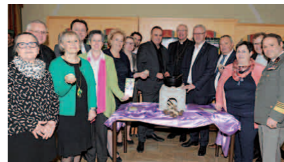
Suppenessen im Domzentrum

Die Vorbereitung und die Feiern des ökumenischen Weltgebetstages der Frauen, Maianachten, Kreuzwege, Oasen des Glaubens, Frauenfeste, Frauen-