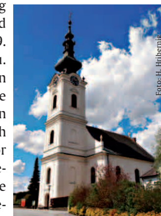
Evang. Kirche Markt Allhau

Anmeldungen für den Chortag werden von mir gerne entgegengenommen! Auf www.vecoe.info und www.evangel-musik-bgld.at wird es in Kürze mehr Infos geben. Ich hoffe, viele von Ihnen bei einer dieser musikalischen Begegnungen zu treffen! ■