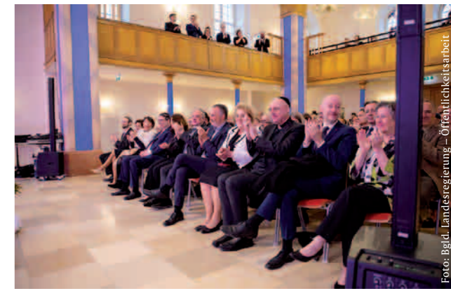
Eröffnung der ehemaligen Synagoge Kobersdorf als Mahnmal und Veranstaltungsort

Nach dem Ende des 2. Weltkrieges gab es die jüdische Gemeinde in Kobersdorf nicht mehr; damit war die Synagoge dem Verfall preisgegeben. Ein privater Verein bemühte sich um die Renovierung des Gebäudes und wollte eine Gedenkstätte errichten. Leider scheiterte dies an vie-