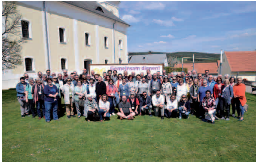
Die Teilnehmer*innen an der Lektorentagung