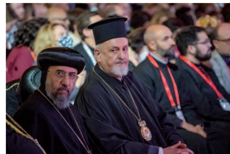
Ökumenische Vielfalt (v.l.): Erzbischof Angaelos, Koptisch-Orthodoxe Kirche und Metropolit Emmanuel von Chalcedon, Ökumenisches Patriarchat

chat wie gewohnt Delegierte entsandte. Die Positionen der Kirchen zum Ukrainekrieg sind