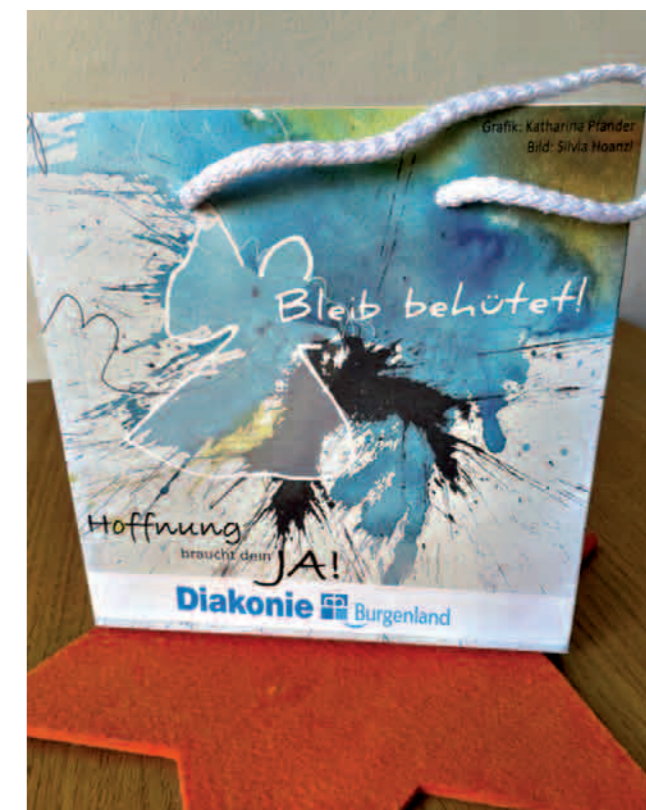
Erhältlich in der Diakonie um € 2,50 pro Stück