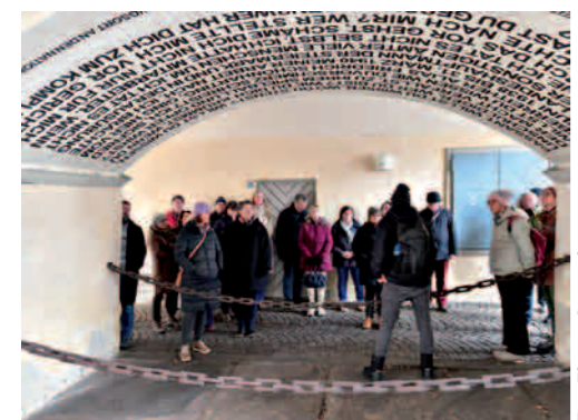
Der deutsche Künstler Jochen Gerz hat diese Worte dem ehemaligen NS-Landeshauptmann

Ein Mahnmal, das betroffen macht, fand sich gleich am Beginn unseres Stadtspaziergangs im Inneren des Burgtors.