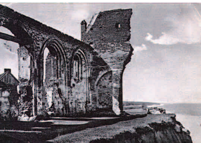
Blick von der zerstörten Kirche in Quneitra auf den Golanhöhen aus dem Jahr 2007; © BMLV

Es war ein Abend, der noch lange als Beispiel für gelebte Nachbarschaft im Dorfgespräch bleiben wird. ■